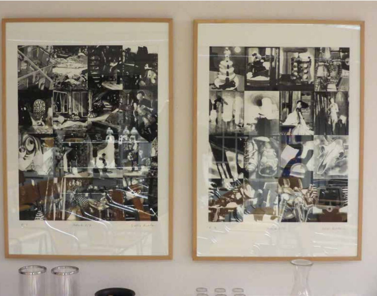
Digitaldruck e.a., Format 70 × 100cm, signiert

2 mal 16 Tuschebilder aus dem ersten Buch: « Dunkle Orte, helle Worte »