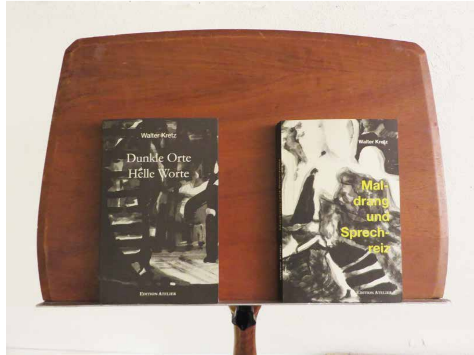
Die 2 Kretz-Bücher Edition Atelier Bern, 2014 und 2017