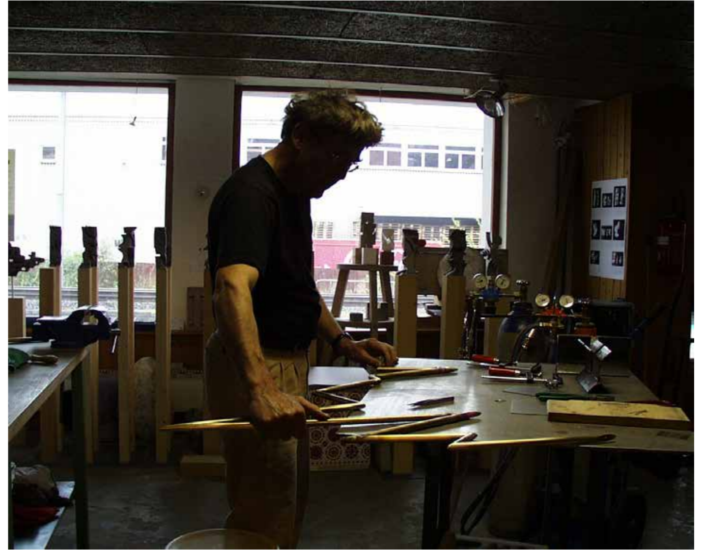
Arbeit auf der Eisenplatte