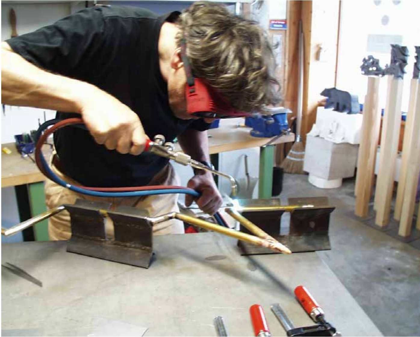
Arbeit auf der Eisenplatte mit den Prismenständern