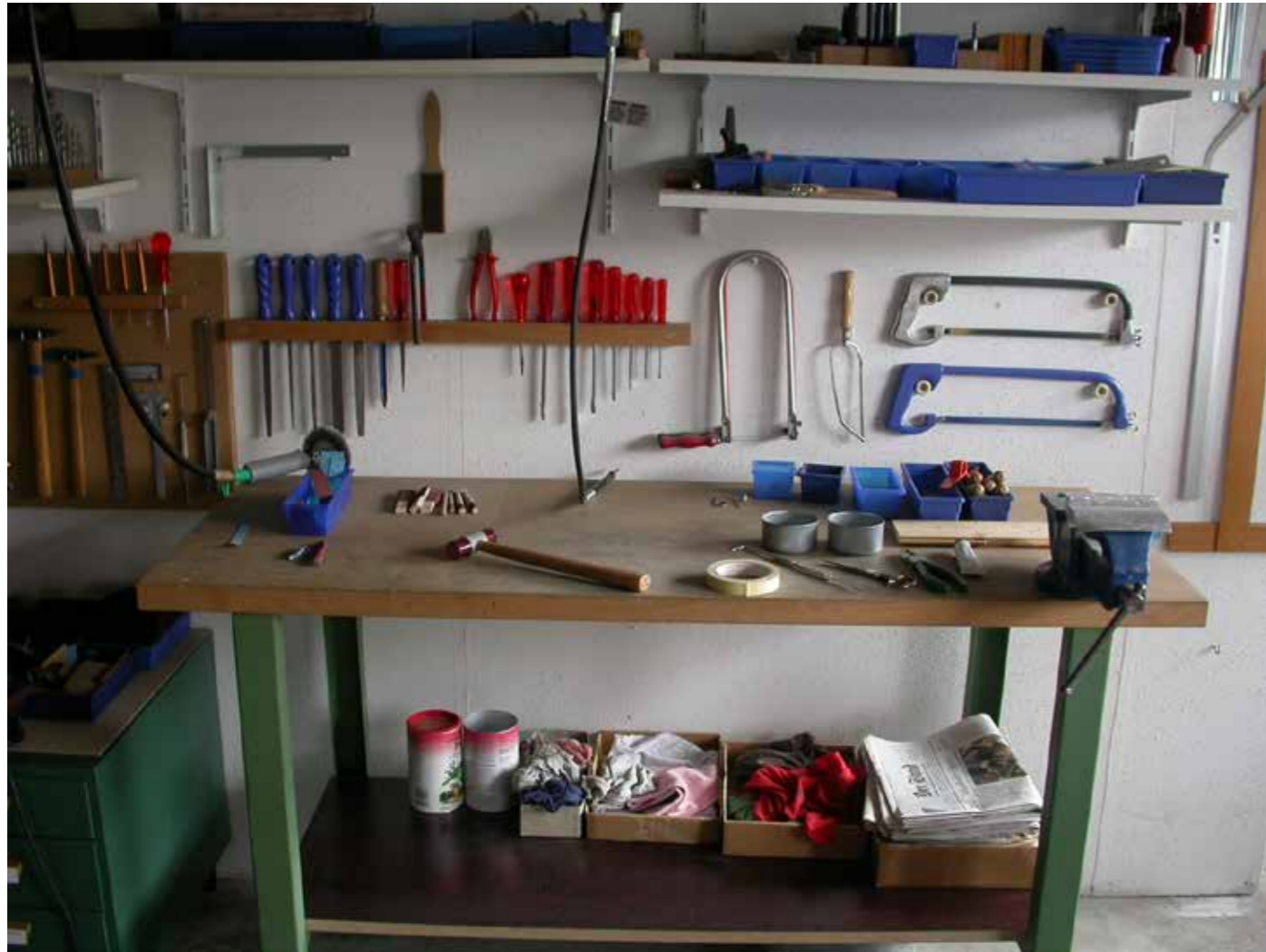
Werkbank im Atelier Rüfenacht 2021