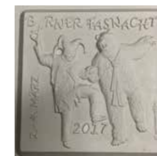
41 x 41 mm