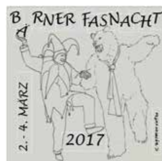
41 x 41 mm