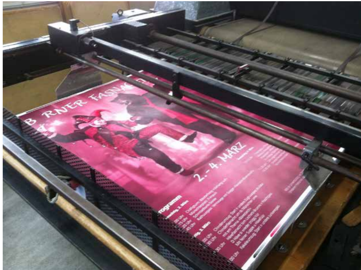
Plakatdruck in der Serigrafie Uldry in Hinterkappelen