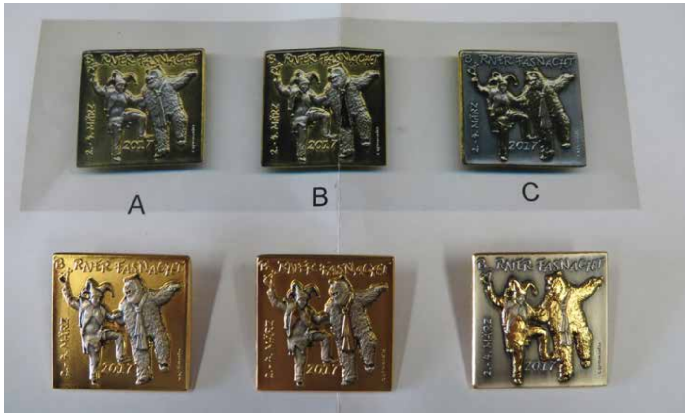
3 Gold-Plakettenvarianten Ausführung C